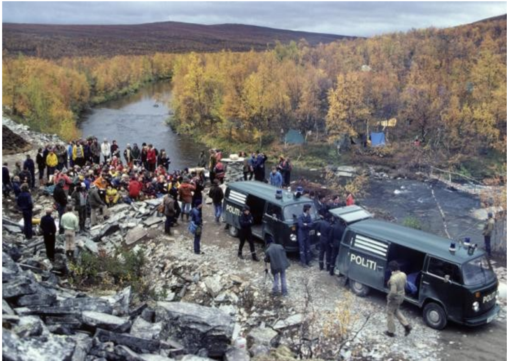
Protesty proti výstavbe priamo v dedinke ALTA od októbra 1981 /policajné zásahy/