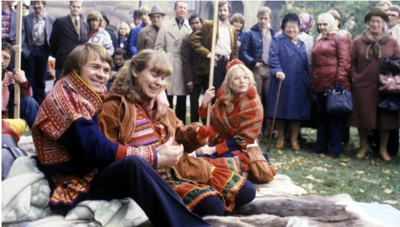
Sámovia pred parlamentom v OSLO /1979/